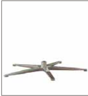
5-Sternfuß verschiedene Metallfarben 3 Sitzh. - FU1 F 99