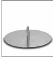
Drehteller verschiedene Metallfarben 3 Sitzh. - FU2, F 6Q