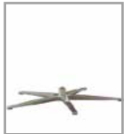
5-Sternfuß versch. Metallf.