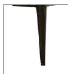
Metallfuß versch. Metallfarben