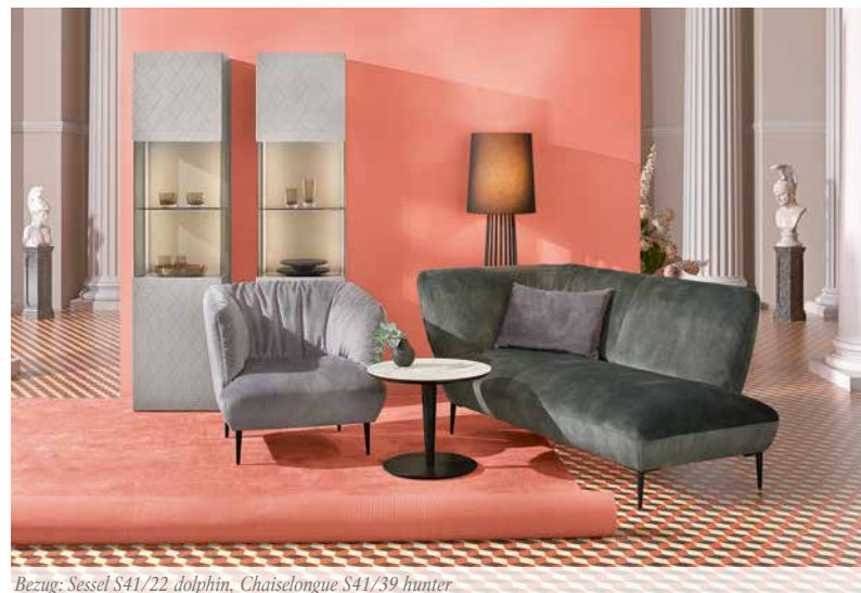
Bezug: Sessel S41/22 dolphin, Chaiselongue S41/39 hunter