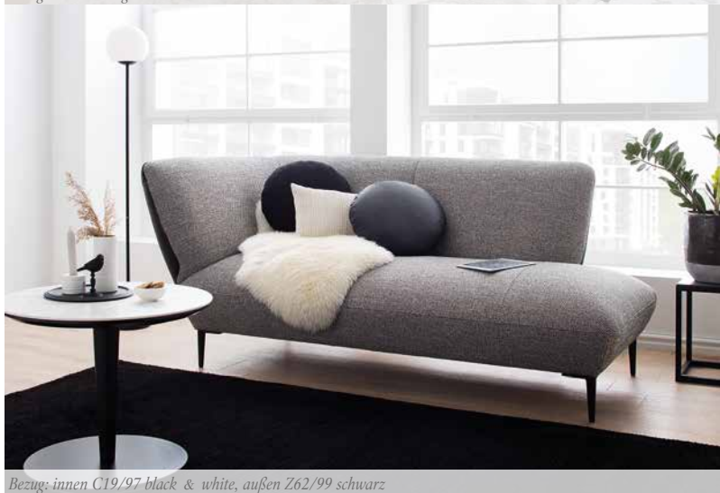
Bezug: innen C19/97 black & white, außen Z62/99 schwarz