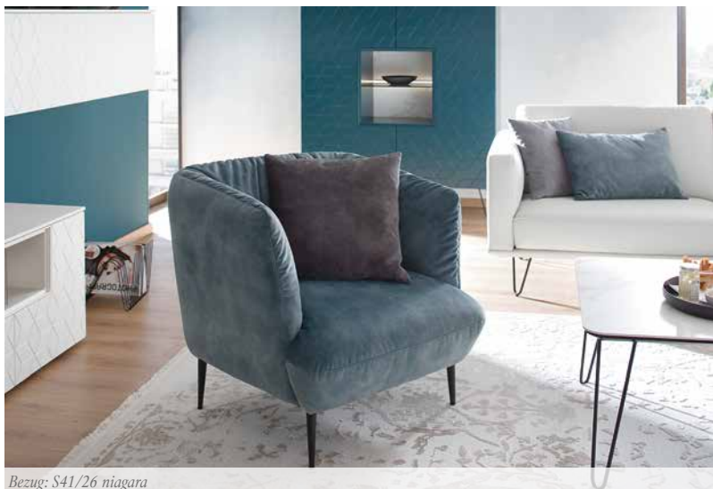
Bezug: S41/26 niagara