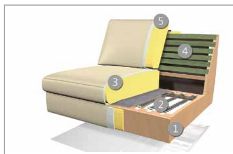
Das Design des hier abgebildeten Querschnitts entspricht nicht dem Modell dieses Katalogblattes.