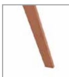
Holzgestell Eiche geölt P58