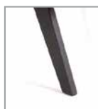
Holzgestell Eiche schwarz P99