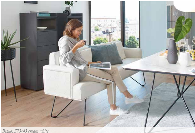
Bezug: Z73/43 cream white