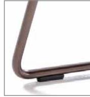
Drahtrohrgestell schwarz pulver- besch. F M5