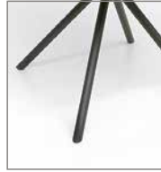
Stativfuß fest schwarz F 2F