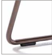
Drahtrohrgestell schwarz pulver- besch. F M5