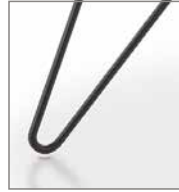
Haarnadelgestell schwarz pulver- besch. F 11