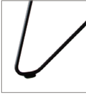
Haarnadelfuß schwarz pulverbe- schichtet F 04