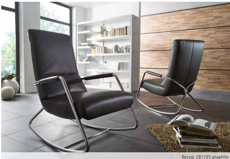
Bezug: Z87/95 graphite