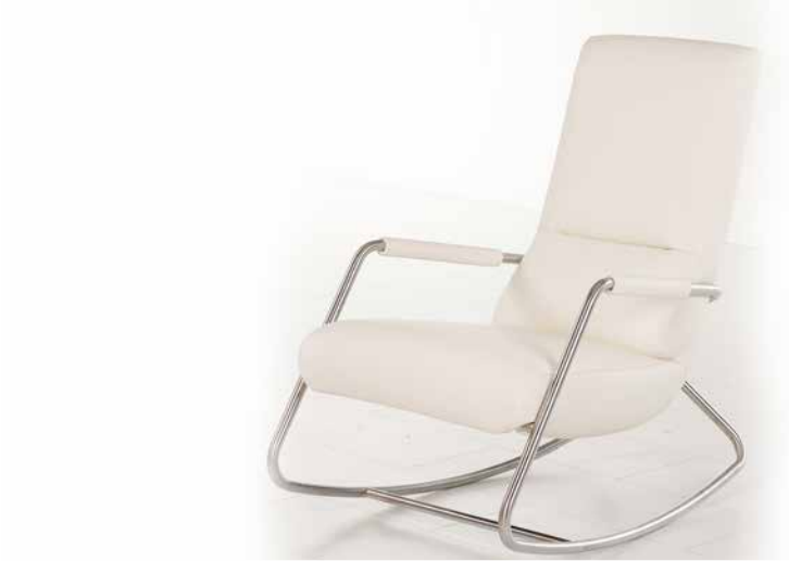
Bezug: Z70/42 weiß

Hier zeigen wir Ihnen mögliche Zusammenstellungen des Modells in ausgewählten Bezügen auf. Lassen Sie sich inspirieren!