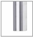
Schaukelgestell Chrom glänzend