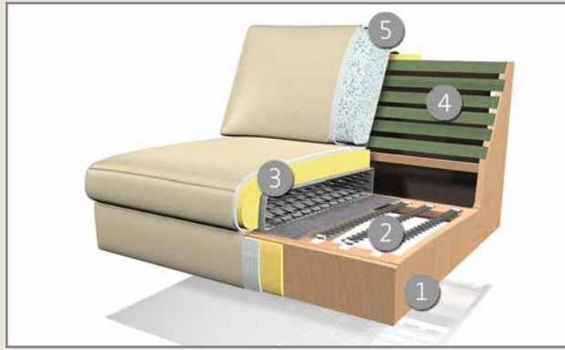
Das Design des hier abgebildeten Querschnitts entspricht nicht dem Modell dieses Katalogblattes.