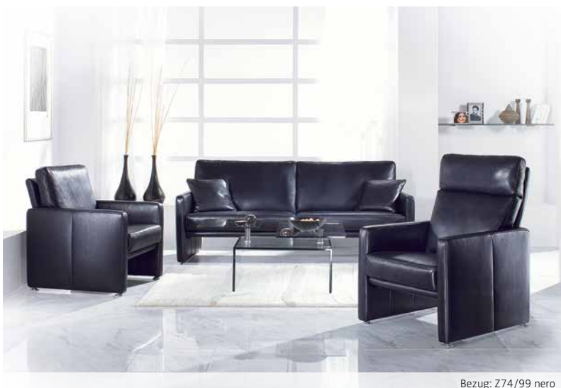
Bezug: Z74/99 nero