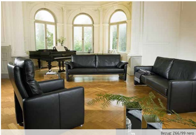
Bezug: Z66/99 nero

Hier zeigen wir Ihnen mögliche Zusammenstellungen des Modells in ausgewählten Bezügen auf. Lassen Sie sich inspirieren!