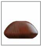
Holzfuß, versch. Farben