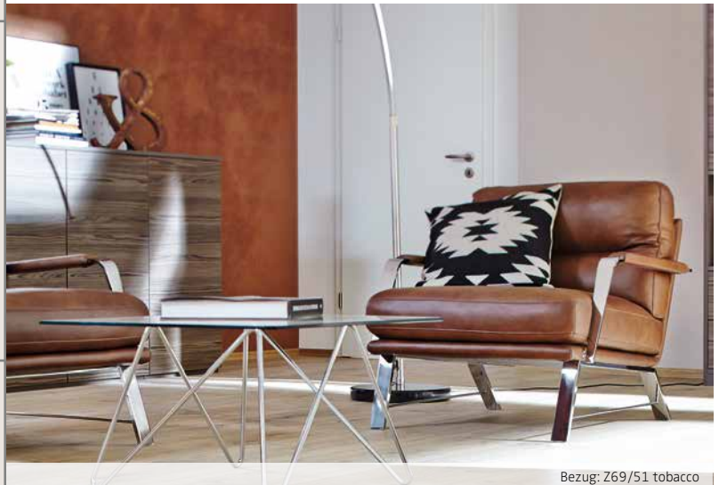
Bezug: Z69/51 tobacco

Bei diesem Modell wurden im Sitz und Rücken Kammerkissen verarbeitet, welche mit einem hochwertigen Gemisch aus Polyesterfasern und Schaumstoffstäbchen gefüllt sind. Dies kann zur Abzeichnung der einzelnen Kammern führen und ist eine warentypische Eigenschaft.