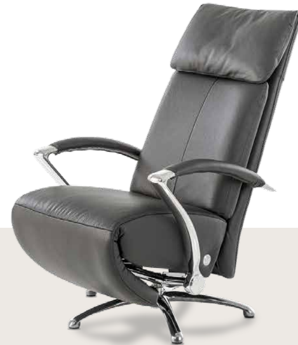
Bezug: Z73/95 graphit

Sitzkomfort empfindet jeder anders - und genau darauf geht das ergorelaxx -Programm ein. Das Kopfteil ist stufenlos verstellbar. Die Rückenlehnen lassen sich durch einfache Gewichtsverlagerung bequem nach hinten neigen. Weitere Verstellmöglichkeiten bestehen manuell (via Einsatz einer Gasdruckfeder) oder motorisch. Design: Wilhelm Bolinth