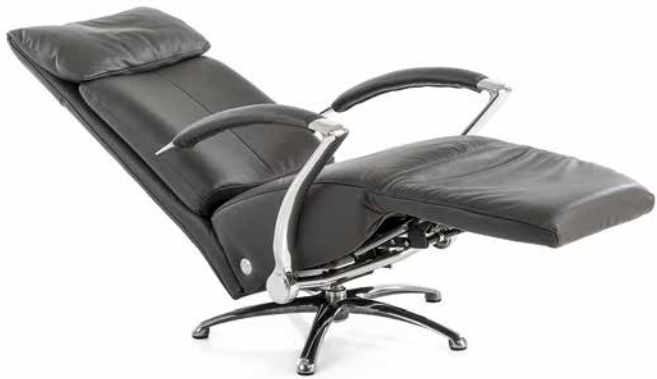
Bezug: Z73/95 graphit