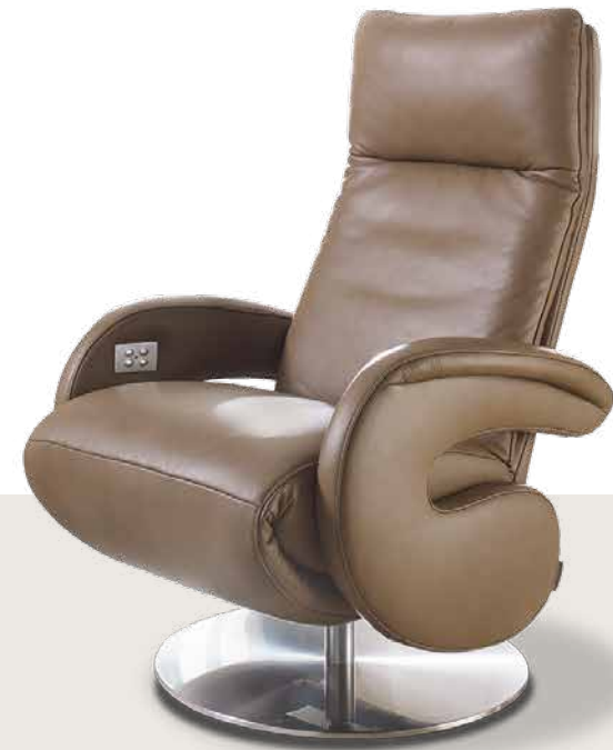
Bezug: Z73/50 terra