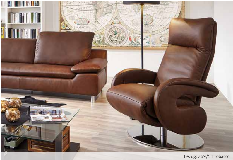
Bezug: Z69/51 tobacco