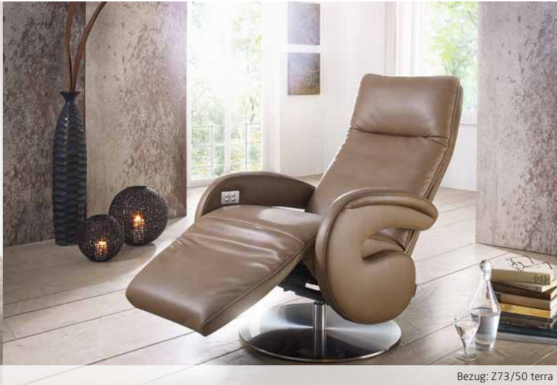
Bezug: Z73/50 terra