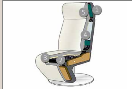
Das Design des hier abgebildeten Querschnitts entspricht nicht dem Modell dieses Katalogblattes.