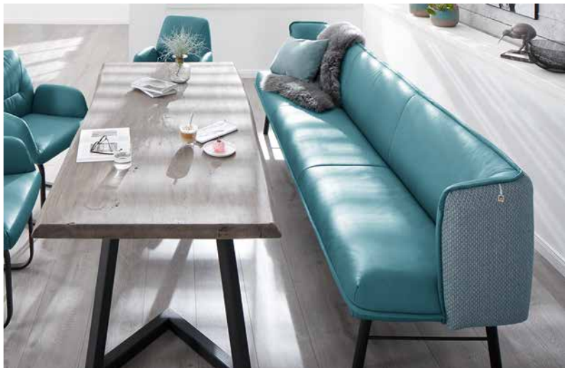
Bezug: Rücken/Seitenteil außen V49/27 blue; Sitz/Rücken/Seitenteil innen Z79/26 petrol blue